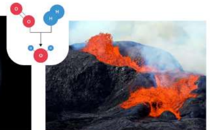
2 I vulcani hanno avuto un ruolo cruciale nella creazione di mari e oceani.

anidride carbonica e azoto) rilasciati dai vulcani. Probabilmente il magma conteneva al suo interno dell' acqua , che risalì verso la superficie attraverso i crateri vulcanici e finì per essere vaporizzata e dispersa nell'atmosfera durante le eruzioni. Con il passare del tempo, un lento e progressivo raffreddamento del pianeta causò la condensazione del vapore il quale, trasformandosi in acqua, precipitò al suolo insieme all'anidride carbonica, dando origine ai primi mari. E probabilmente è per lo stesso meccanismo che nei milioni di anni successivi si formarono oceani, fiumi e laghi.