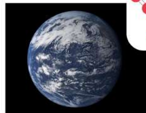
1 L'Oceano Pacifico visto dallo spazio

1 Sintesi delle molecole d'acqua dagli elementi idrogeno e ossigeno.